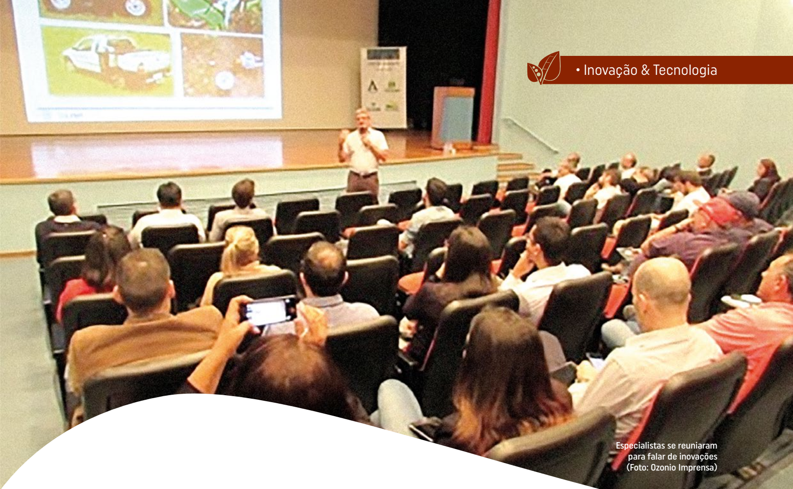
Especialistas se reuniram para falar de inovações