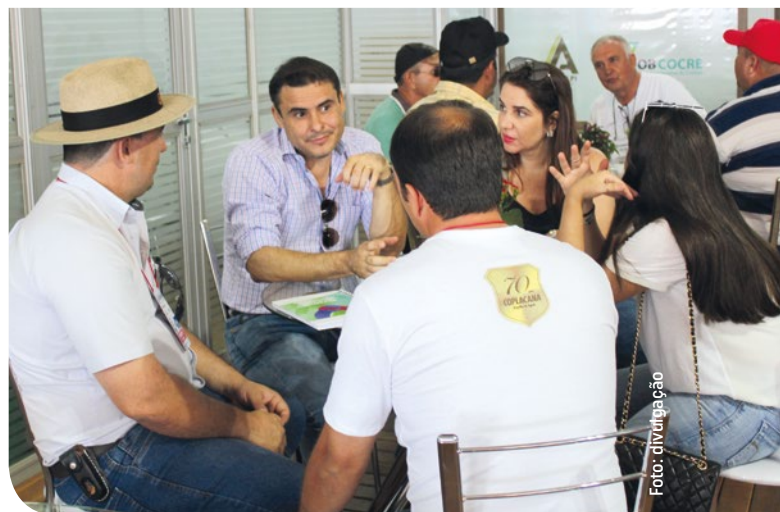
Estande da cooperativa recebeu público durante a Agrishow

Durante a Agrishow, a equipe da COPLACANA divulgou todo trabalho que é desenvolvido na cooperativa e mostrou a estrutura e a capacidade de atender os produtores nas mais diversas áreas agrícolas. "Após